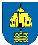
Wójt Gminy Boronów Krzysztof Belkot