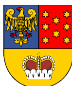
Starosta Lubliniecki Joachim Smyła